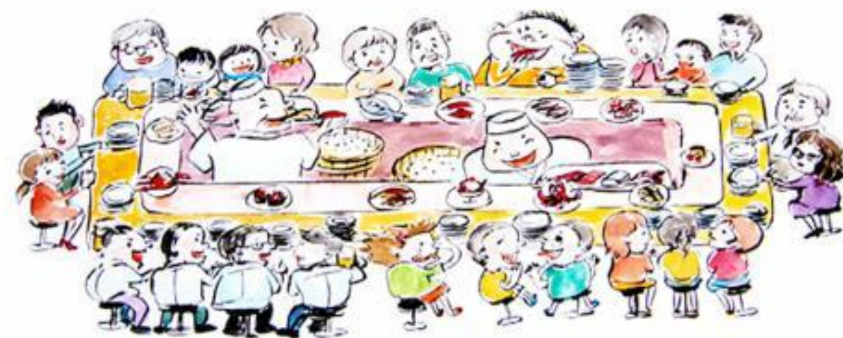
ヤマハ音楽振興会様 挿し絵